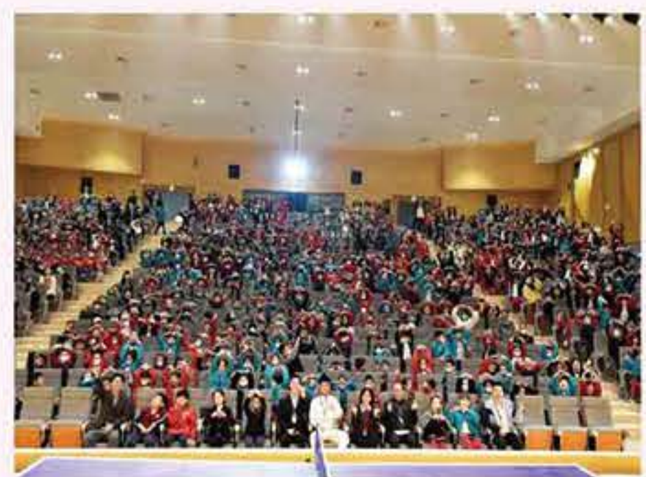
冲吧！孩子们，你们也一定会飞得更高！

最后，同学们在表示致敬英雄、致敬冠军的同时，也要将自己的家国意识、爱国精神、感恩之心落实到生活中，向彭教练学习，挑战自我、坚持不懈、勇于成功、努力拼搏！